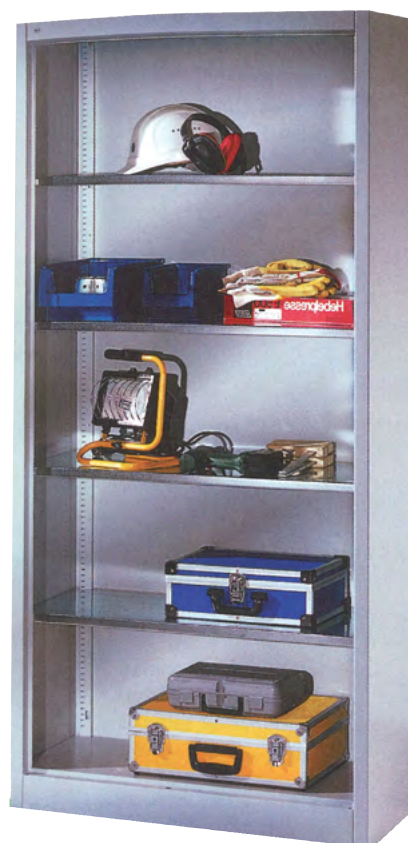
Etagère H 1 950

Caractéristiques : construction en acier monobloc. Réglage des étagères au pas de 15 mm. Résistance 75 kg par tablette zinguée. Structure laquée époxy polyester coloris gris clair RAL 7035. Autres coloris sur demande.